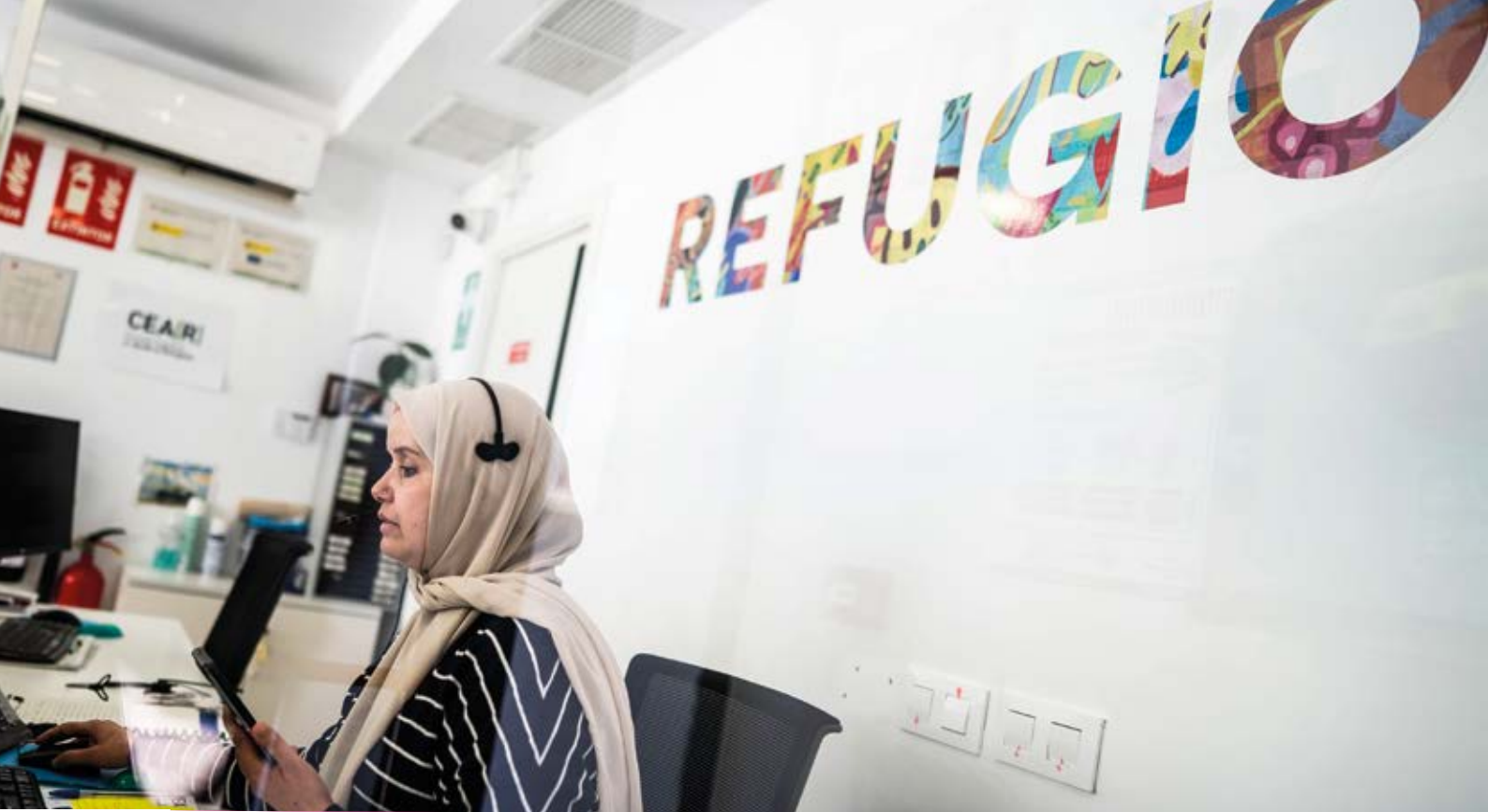
Una trabajadora de CEAR atiende diariamente a las personas que solicitan información sobre el acceso a la Protección Internacional en España. Febrero de 2026, Madrid.

2025 estuvieron activos los CIE de Algeciras, Barcelona, Las Palmas, Murcia, Valencia y Madrid; el de Tenerife permaneció inactivo por cuarto año consecutivo. El nuevo CIE de Algeciras-Botafuegos, con 500 plazas, entró en funcionamiento en fase de pruebas en noviembre de 2025. Este macrocentro es el mayor de España, y su creación y puesta en marcha acentúa la visión criminalizadora hacia las migraciones, tal como denuncia la Coordinadora contra los CIE y las organizaciones miembros de la red Migregroup en España, entre las que se encuentra CEAR, que rechazan la apertura de nuevos centros.