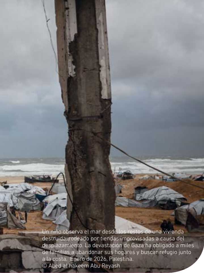
Un niño observa el mar desde los restos de una vivienda destruida, rodeado por tiendas improvisadas a causa del desplazamiento. La devastación de Gaza ha obligado a miles de familias a abandonar sus hogares y buscar refugio junto a la costa. Enero de 2026, Palestina.