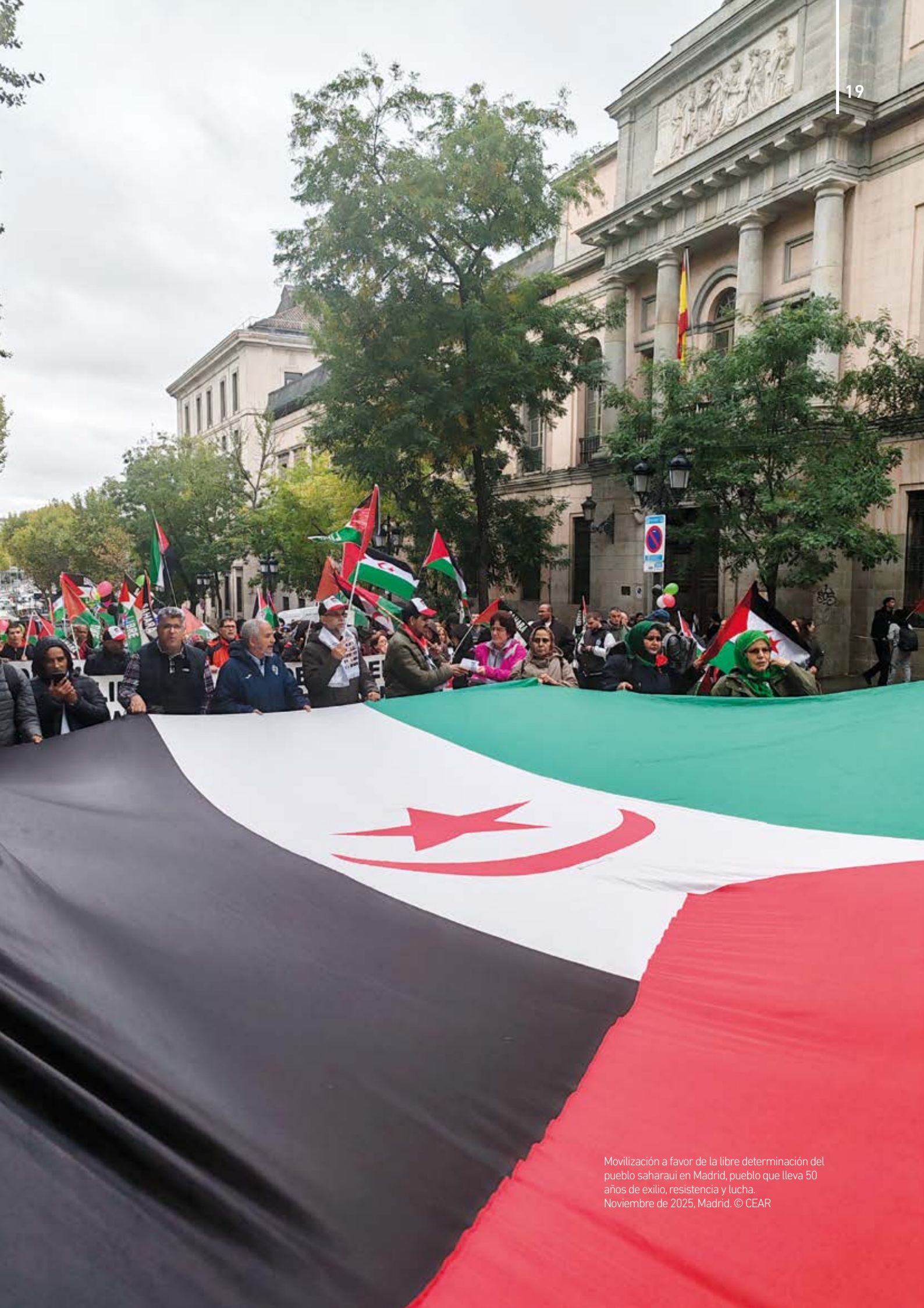
Movilización a favor de la libre determinación del pueblo saharai en Madrid, pueblo que lleva 50 años de exilio, resistencia y lucha. Noviembre de 2025, Madrid.