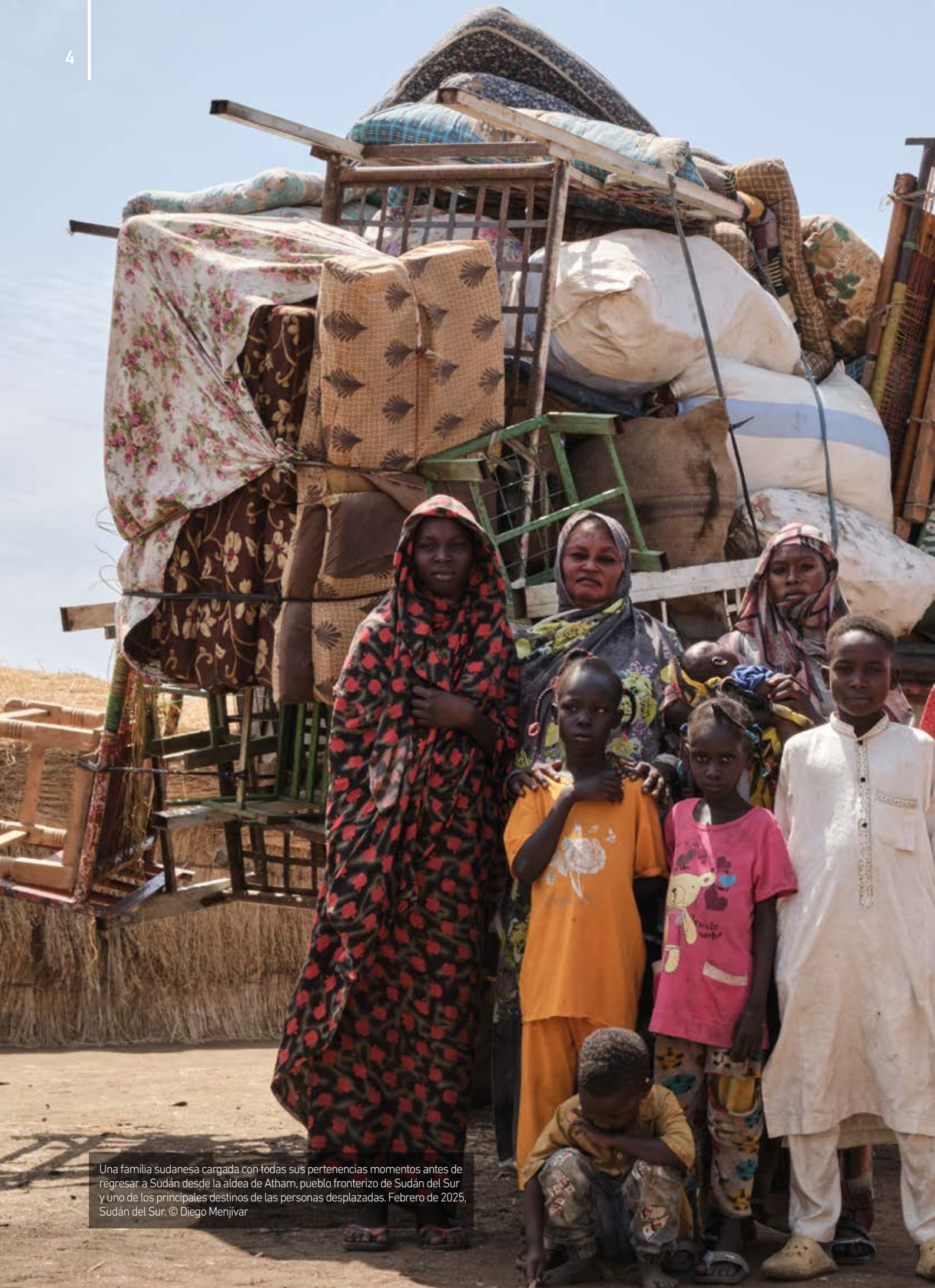
Una familia sudanesa cargada con todas sus pertenencias momentos antes de regresar a Sudán desde la aldea de Atham, pueblo fronterizo de Sudán del Sur y uno de los principales destinos de las personas desplazadas. Febrero de 2025, Sudán del Sur.