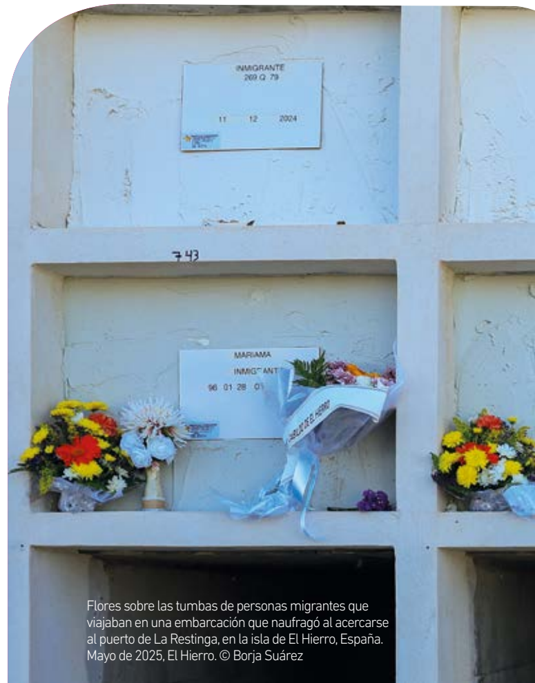
Flores sobre las tumbas de personas migrantes que viajaban en una embarcación que naufragó al acercarse al puerto de La Restinga, en la isla de El Hierro, España. Mayo de 2025, El Hierro.

Asimismo, si bien se han mantenido las principales nacionalidades de llegada registradas en 2024, estas han experimentado algunas variaciones. Así, en 2025, las personas llegadas a costas fueron principalmente originarias de Argelia (27 %), Malí (17 %), Marruecos (15 %) y Senegal